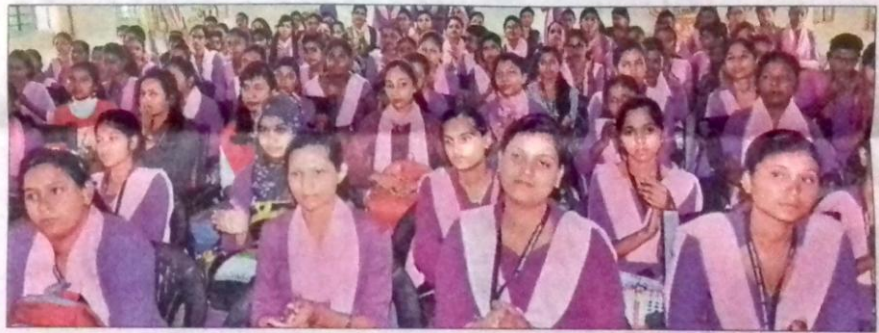
अरविंद महिला कॉलेज में बुधवार को सड़क सुरक्षा जागरूकता कार्यशाला में शामिल छात्राएं। • हिन्दुस्तान

इस दौरान प्राचार्या ने कहा कि शहर में कंस्ट्रक्शन का काम चल रहा है। इसलिए छात्राओं को सड़क पर अधिक सजग रहना चाहिए। हेलमेट और सीट बेल्ट लगाने की भी उन्होंने सलाह दी। इस दौरान सड़क सुरक्षा पर एक नुक्कड़ नाटक की प्रस्तुति हुई। नाटक से छात्राओं को सड़क पर सुरक्षित रहने के