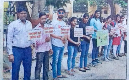
सड़क सुरक्षा को लेकर रोड शो के दौरान स्टूडेंट व अन्य.